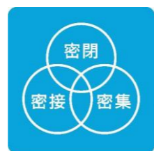
3つの「密」を さげよう